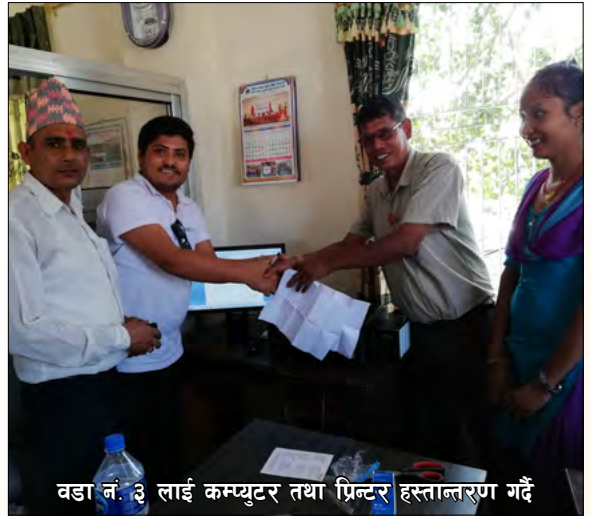
वडा नं. ३ लाई कम्प्युटर तथा प्रिन्टर हस्तान्तरण गर्दै