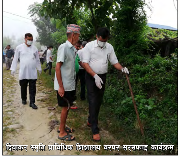
दिवाकर स्मृति प्राविधिक शिक्षालय वरपर सरसफाइ कार्यक्रम