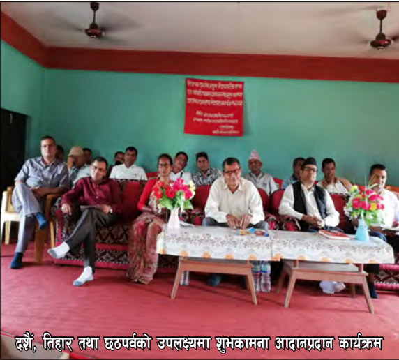
दशैं, तिहार तथा छठपर्वको उपलक्ष्यमा शुभकामना आदानप्रदान कार्यक्रम