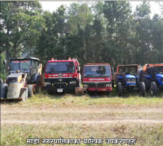
माडी नगरपालिकाका याञ्चिक उपकरणहरू