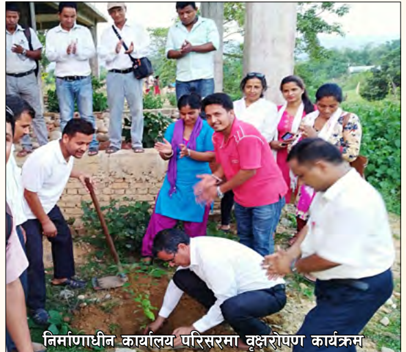
निर्माणाधीन कार्यालय परिसरमा वृक्षरोपण कार्यक्रम