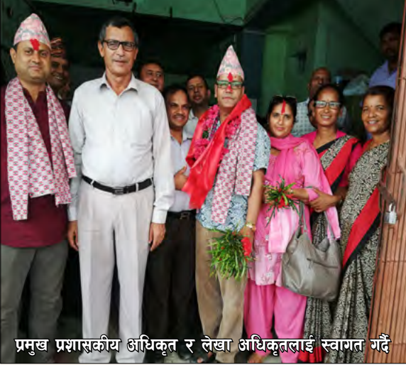
प्रमुख प्रशासकीय अधिकृत र लेखा अधिकृतलाई स्वागत गर्दै