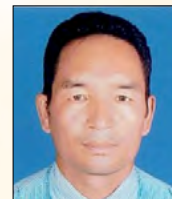
जगराम प्रजा कार्यपालिका सदस्य